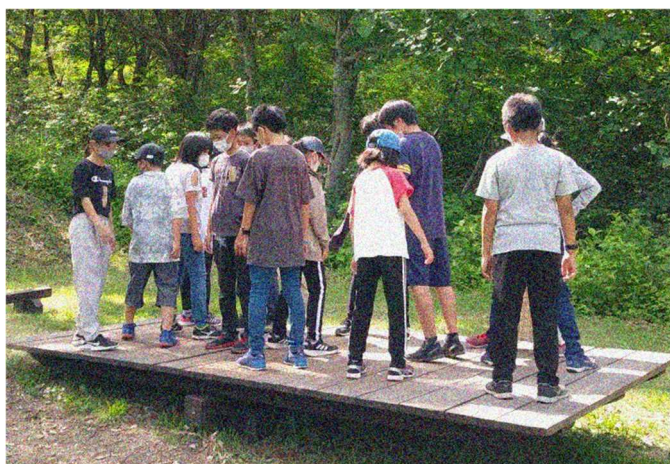
「妙高アドベンチャー」の様子

6月21日（月）から23日（水）の2泊3日で5年生が自然教室に行ってきました。場所は妙高市にある国立妙高青少年自然の家です。グループの仲間で知恵を出し合って課題を解決する妙高アドベンチャー、薪で火をおこしてご飯やカレーを作った野外炊飯、グループで考え練習したスタントをみんなで楽しんだキャンドルサービス、沢をのぼり水中生物を採取したり、植物を観察したりして自然に触れた源流探検等、日頃の学校生活では経験できないことがいくつも体験でき、充実した3日間を過ごすことができました。